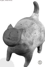
①松田剣《猫》2012年 ②高橋弘明《ジャパニーズ・ポプティル》1924年 ③西誠人《伸太郎》2002年 ④歌川国利《しんぼんねこ屋》(部分) 明治初期