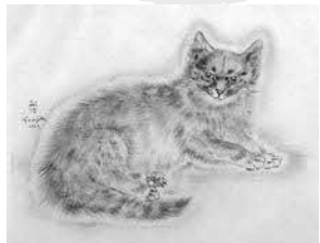
レオナルド・フジタ《ミラ（「猫二十態」より）》1930年 © Fondation Foujita / ADAGP, Paris & JASPAR, Tokyo, 2020 G2406

Cats in Art from the Maneki-Neko-Tei Collection