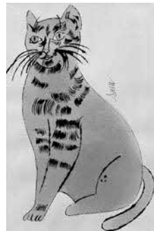
アンディ・ウォーホル (Sam) 1954年